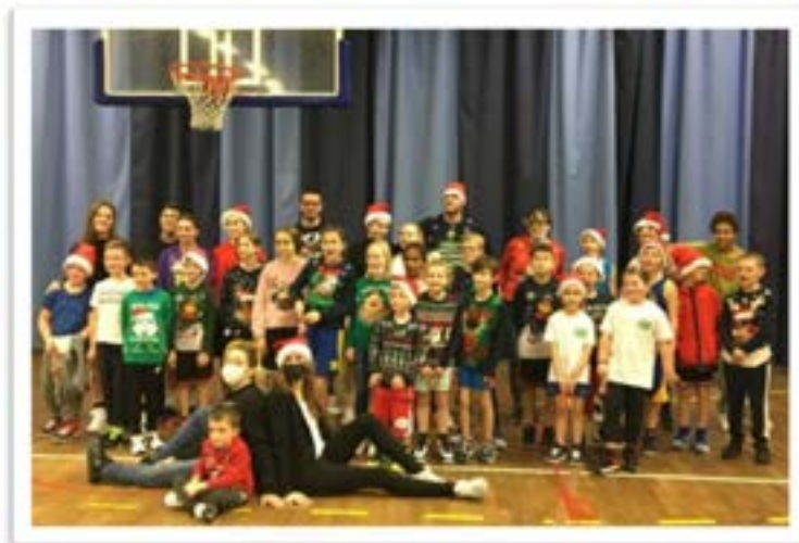
Le traditionnel goûter de Noël de l'AJ Basket a été organisé avec un format revisité.