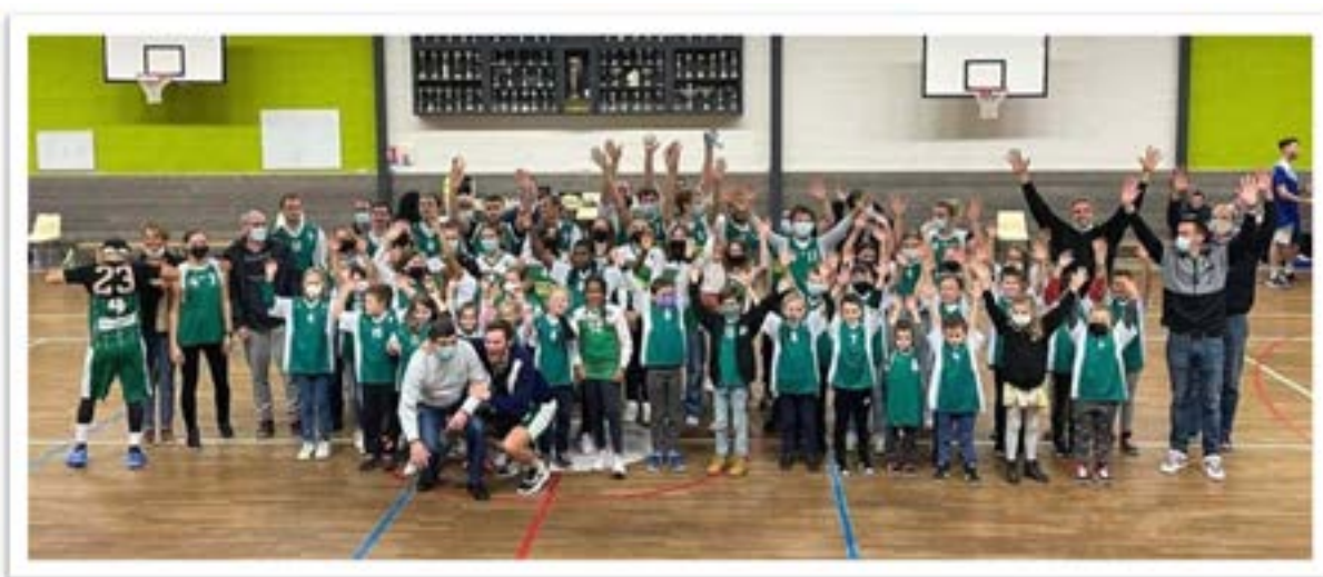
La présentation des équipes fut un réel succès

Le club alerte par ailleurs ses licenciés et les habitants de Cagny sur la fragilité d'une association comme la leur. En effet, la gestion d'un club de basket nécessite beaucoup de temps et d'investissement puisqu'ils doivent gérer 150 licenciés, un salarié, mais également l'administration et l'organisation des championnats, appliquer les règlements de leur fédération, etc. Le Bureau, en place depuis plusieurs années maintenant, arrive à la fin d'un cycle, et souhaite pouvoir intégrer de nouveaux bénévoles pour plus de sérénité.