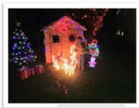
Rue de la Gare