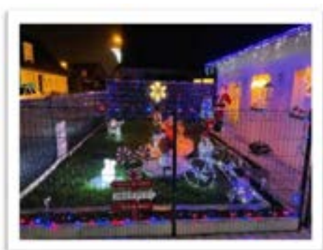
Rue de l'Éolienne